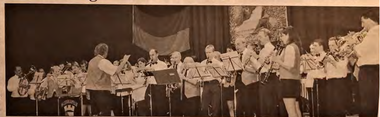
Imposantes Bild: Beim Finale des Konzerts standen die Kapellen aus Geroldsau und Ungarn gemeinsam auf der Bühne.