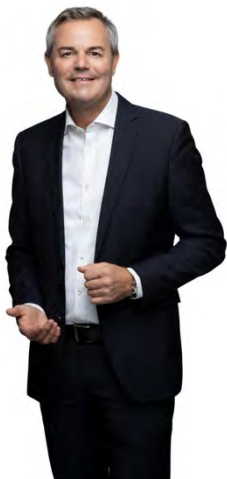
Tobias Wald MdL Präsident des Blasmusikverbandes Mittelbaden e.V.

Die Musikkapelle Geroldsau e.V. darf in diesem Jahr auf beeindruckende 125 Jahre bewegter Vereinsgeschichte zurückblicken. Hierzu gilt allen Musikern und Unterstützern dieser vielen Jahre mein herzlicher Dank und Anerkennung.