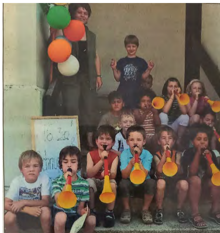
Schnuppertag in Geroldsau

Natürlich braucht es auch Verantwortliche im Verein, die sich um alles kümmern, was mit Musikunterricht zu tun hat. Kindern muss man manchmal auch andere Freizeitaktivitäten neben dem Musizieren bieten, damit sie bei der Stange bleiben und den Spaß nicht