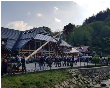
Die Eröffnung der Geroldsauer Mühle im Sommer 2015 hat uns für die nächsten Jahre einige